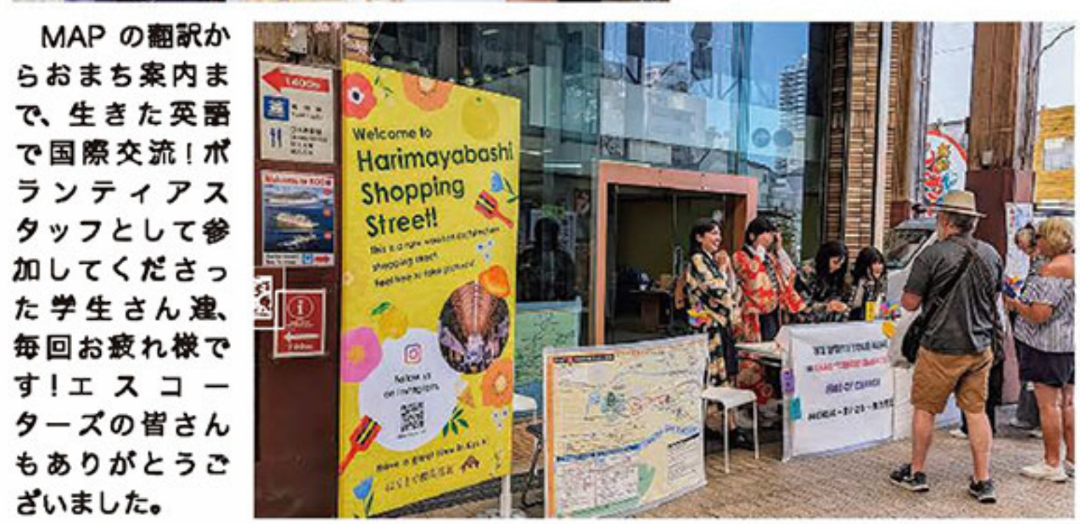
憧れのKIMONOも、お土産に喜ばれるそうですよ。ポーさんの葉のお着物もマスクもとってもお似合いです。