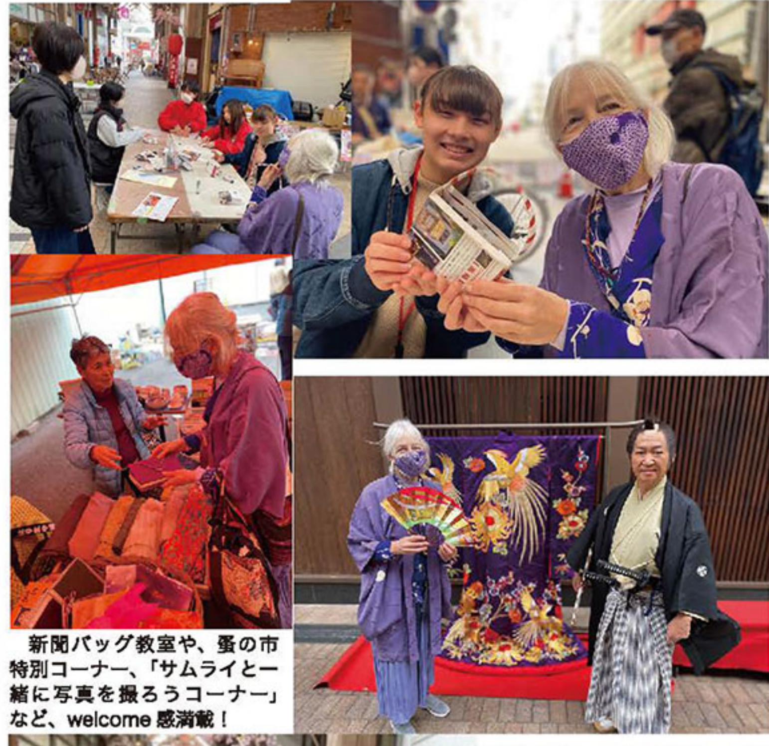
新聞バッグ教室や、蚤の市特別コーナー、「サムライと一緒に写真を撮るコーナー」など、welcome感激戦!