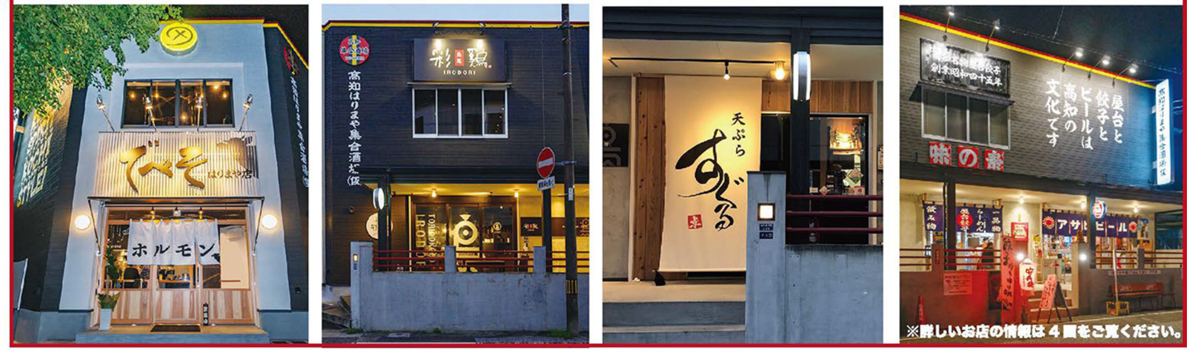
※詳しいお店の情報は4面をご覧ください。