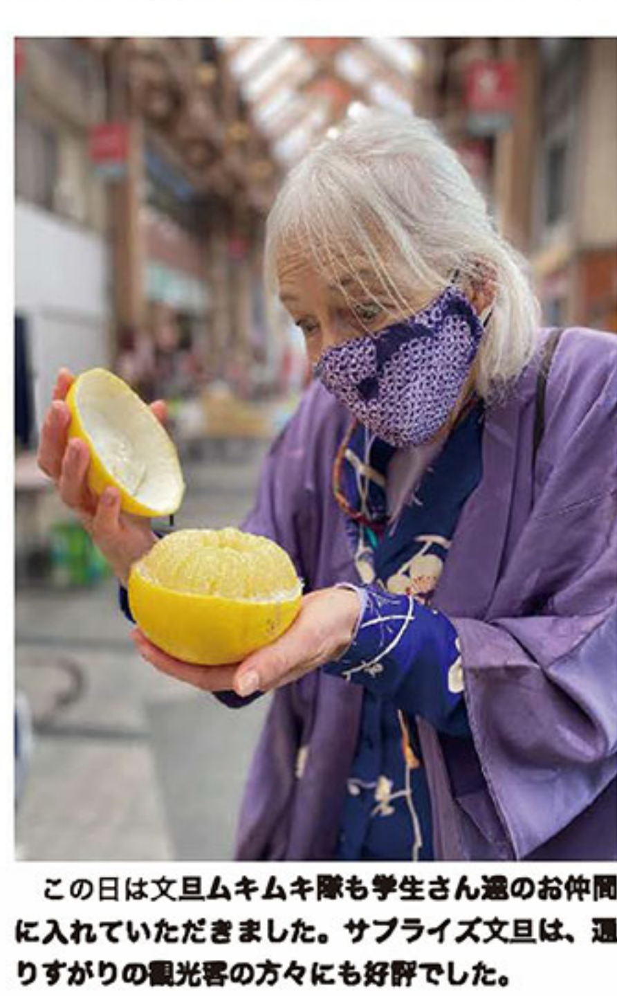
この日は文旦ムキムキ隊も学生さん達のお仲間に入れていただきました。サプライズ文旦は、通りすがりの観光客の方々に好評でした。