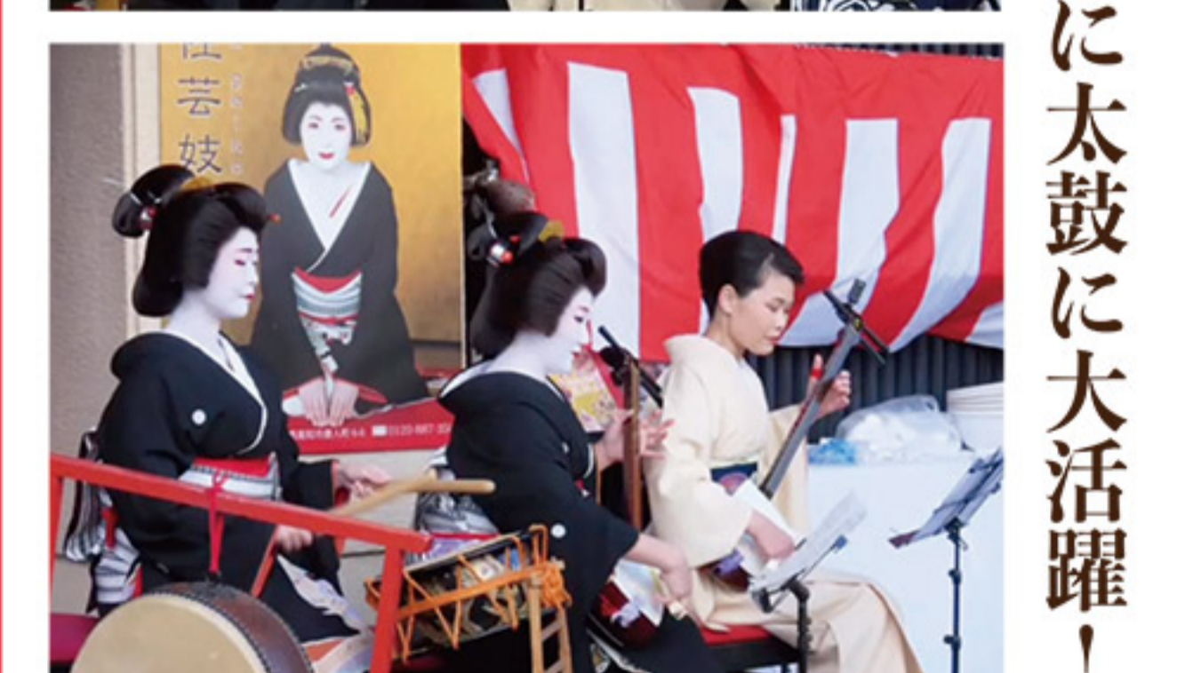
料亭 濱長 年納め三味線餅つきでも、三味に太鼓に大活躍！