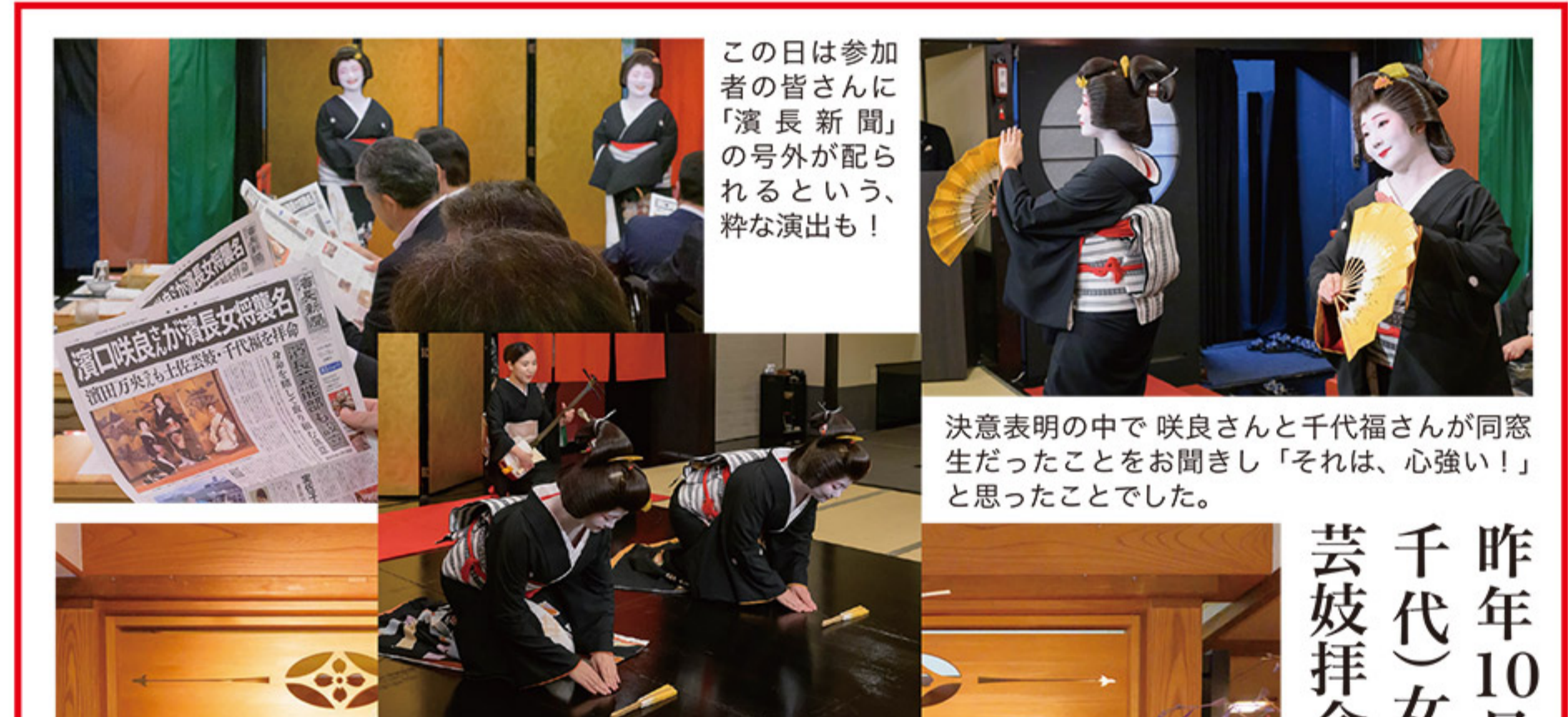
この日は参加者の皆さんに「濱長新聞」の号外が配られるという、粋な演出も！